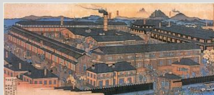
世界遺産登録「富岡製糸場」