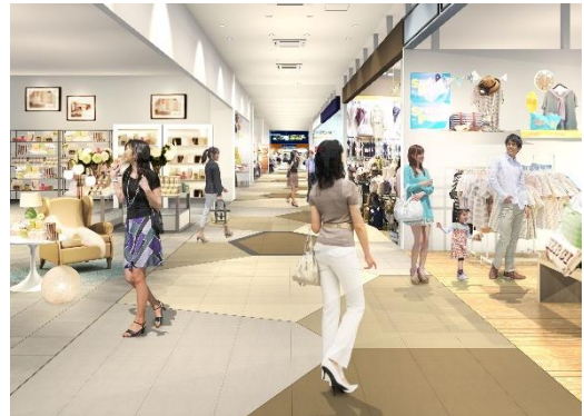
コクーン1 1F 画像はイメージです